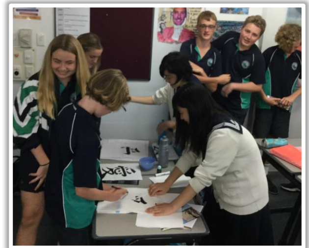
授業風景(文化交流 -書道- )